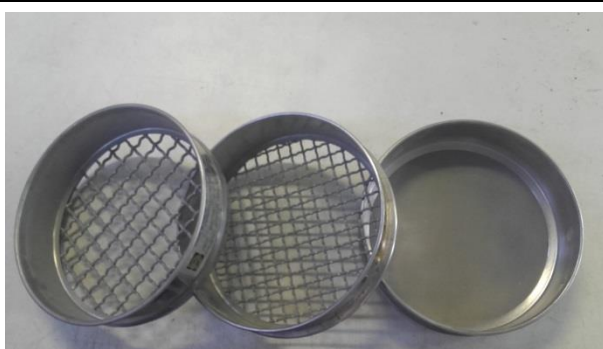
Peneiras redondas de caixilho de 210 mm