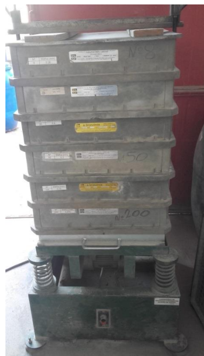
Peneirador com uma série de peneiras quadradas