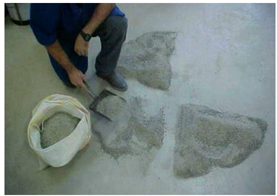
Quarteamento de amostra