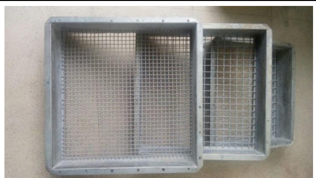
Peneiras quadradas de caixilho de 500 x 500 mm