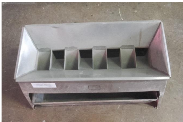
Repartidor de amostra