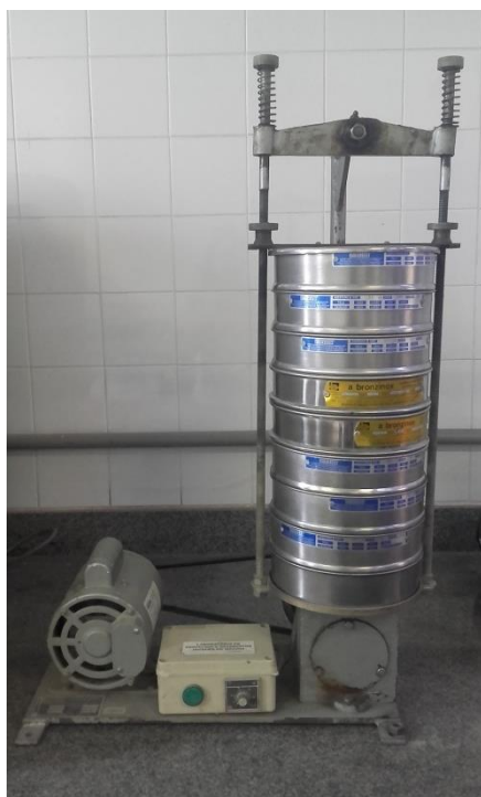
Peneirador com uma série de peneiras redondas