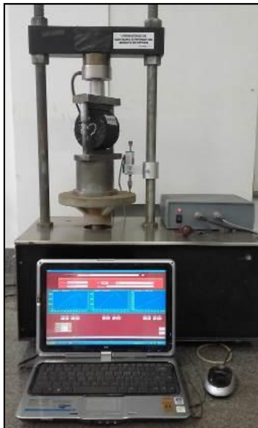
(b) Prensa com Sistema Automatizado com Célula de Carga