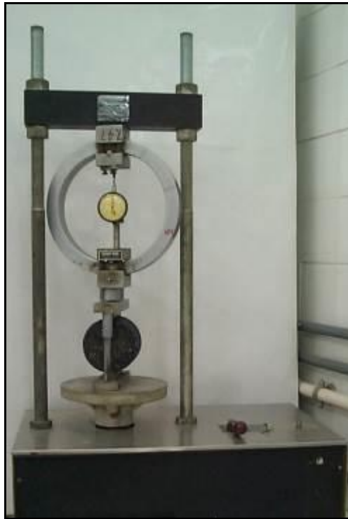
(a) Prensa com Anel Dinamométrico