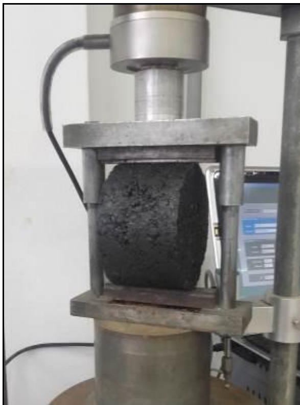
(a) – Dispositivo centralizador de corpo de prova.