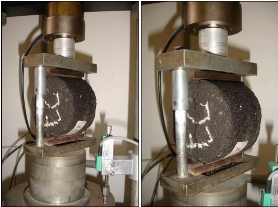
(a) Antes do ensaio

Fotos do corpo de prova antes e depois do ensaio